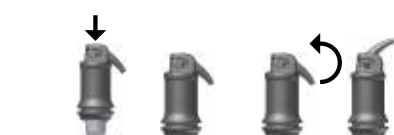
Εικ. 1: Ενεργοποίηση της κάψουλας εφαρμογής

Ανοίξτε προσεκτικά την έξοδο σηκώνοντας το ρύγχος της κάψουλας μέχρι τέλους (βλ. εικ. 2) και εφαρμόστε το υλικό κατευθείαν μέσα στην κοιλότητα μέσα σε 15 δευτερά από το τέλος της ανάμιξης, πιέζοντας τις χειρολαβές του εργαλείου εφαρμογής αργά και ομαλά. Το ρύγχος μπορεί να προσαρμοστεί κατά απαίτηση, περιετρώοντας ολόκληρη την κάψουλα εφαρμογής μέσα στον βραχίονα συγκράτησης του εργαλείου εφαρμογής. Ο χρόνος εργασίας και η συνοχή μπορεί να επηρεαστούν από το αντίστοιχο τύπο σκευής ανάμιξης και από τον χρόνο ανάμιξης.