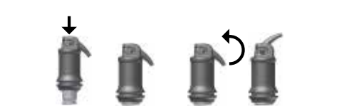
Billede 1: Aktivering af kapslen

Åbn forsigtigt udgangen ved at løfte kanylespiden indtil du mærker et stop (se fig 2). Applicer materialet direkte i kaviteten indenfor 15 sekunder efter blanding, ved at presse aplikatorens håndtag langsomt og jævnt. Kanylen kan vinkles efter ønske ved at dreje hele kapslen i holderen. Arbejdstid og konsistens kan påvirkes ved forskellige typer mixere og blandetider.