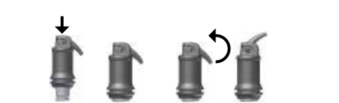
Afb. 1: Capsule activeren

Open de uitlaatopening door de canule tot de voelbare aanslag op te tillen (zie afb. 2) en breng het materiaal uiterlijk 15 seconden na mengende direct in de caviteit aan door de handel van de applicator langzaam, gelijkmatig samen te drukken. Door de gehele applicatiecapsule in de houder te draaien kan de canule naar believen in de juiste stand worden gebracht. Verwerkingstijd en consistentie kunnen worden beïnvloed door het desbetreffende type capsulemengapparaat en de mengtijd.