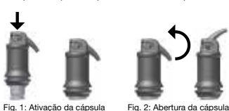
Fig. 1: Ativação da cápsula Fig. 2: Abertura da cápsula

Levantar cuidadosamente a cânula até o fim, para destapar a abertura da cápsula (ver fig. 2) e aplicar o material, no máximo 15 s após o fim da mistura, diretamente na cavidade, pressionando lenta e uniformemente a alavanca do aplicador. A cânula pode ser ajustada da forma desejada, rodando a cápsula de aplicação inteira no suporte. O tempo de trabalho e a consistência podem ser influenciados pelo tipo de misturador de cápsulas e pelo tempo de mistura correspondentes.