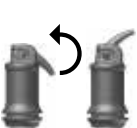
Fig. 2: Deschiderea capsulei

După amestec, IonoStar Molar poate fi manevrat pentru cel puțin 1.5 minute (la temperatura camerei). Preveniți contaminarea cu umezeală a materialului și uscarea acestuia. Dacă nu este posibil să mențineți un câmp de lucru uscat, ar trebui aplicat un lac protector după ce ați terminat manoperele de conturare/modelare (vezi instrucțiunile de utilizare specifice). Restaurarea poate fi finisată, de ex. cu o freză diamantată sau un polipant, cel mai devreme după 5 - 6 minute de la începerea procesului de amestec. Ar trebui aplicat din nou un lac protector (vezi instrucțiunile de utilizare specifice).