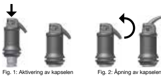
Fig. 1: Aktivering av kapselen

Åpne kapselen forsiktig ved å løfte kanylen inntil du kjenner et stopp (se fig. 2). Appliser materialet direkte i kaviteten innen 15 sekunder etter slutten på mixingen ved å trykke applikatorens håndtak sakte og helt inn. Kanylen kan snus i ønsket retning ved å sru hele applikasjonkapselen inne i holderen. Arbeidstiden og konsistensen kan influeres ved de forskjellige typer mixer og blandetid.