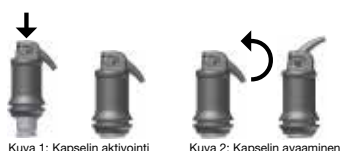
Kuva 1: Kapselin aktiivointi

Avaa varovasti poistoaukko nostamalla applikoitinkerää, kunnes tunnet sen pysähtyvän (katso kuva 2) ja applikoi materiaali suoraan kaviteettiin 15 sekunnin kuluessa sekoittamisen jälkeen puristamalla viejän vipua hitaasti ja tasaisesti. Kanyyli voidaan suunnata vaadittuun suuntaan kääntämällä koko applikoitukapselia viejässään. Työskentelyaikaan ja konsistenssiin vaikuttavat käytettävän kapselin sekoittajan tyyppi ja sekoitusaika.