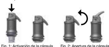
Fig. 1: Activación de la cápsula Fig. 2: Apertura de la cápsula

Abra la boquilla de salida levantando la cánula hasta percibir que se alcanza el tope (véase fig. 2). Como máximo 15 s después de finalizar el mezclado, aplique el material directamente en la cavidad, presionando lenta y constantemente la palanca del aplicador. Girando toda la cápsula de aplicación en el soporte, es posible posicionar la cánula con la orientación deseada. El tiempo de aplicación y la consistencia pueden variar en función del tipo de mezclador de cápsulas que se utilice y del tiempo de mezclado.