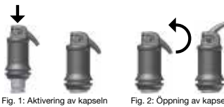
Fig. 1: Aktivering av kapseln

Öppna försiktigt kapseln genom att lyfta spetsen tills ett stopp känns (se fig. 2) och applicera materialet direkt i kaviteten, inom 15 sek. efter blandningens slut, med ett långsamt och stadigt tryck på applikator. Spetsen kan riktas in efter behov genom att hela kapseln vrids i hållaren. Arbetstid och konsistens kan påverkas av olika typer av blandningsapparater och av blandningstiden.