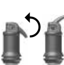
Sl. 2: Otvaranje kapsule

Nakon miješanja IonoStar Molar se može obrađivati minimalno daljnje 1,5 min (sobna temperatura). Izbjegavati kontaminaciju vlagom i isušivanje. Ako se radno područje ne može održavati suhim, nakon izrade obrisa/modeliranja aplicirati zaštitni lak (vidi dotične informacije za uporabu). Najranije 5 - 6 min nakon početka miješanja se restauracija može obraditi npr. dijagnostičnim svrdlom ili svrdlom za poliranje. Nakon toga ponovo treba aplicirati zaštitni lak (vidi dotične informacije za uporabu).