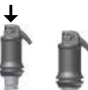
Sl. 1: Aktiviranje kapsule

Podizanjem kanile dok ne osjetite graničnik otvorite otvor za ispuštanje (vidi sl. 2) i materijal aplicirati najkasnije 15 s po završetku miješanja laganim, ravnomjernim pritiskanjem poluge aplikatora izravno u kavitet. Okretanjem cijele aplikacijske kapsule u držaču može centrirati kanilu po želji. Svaki tip mješaća za kapsulu i vrijeme miješanja utječu na vrijeme obrade i konzistentnost.